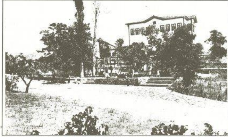
İlk alınan bina : Çocuk Yuvası

günden beri birçok ilavelerle bugünkü şeklini almıştır. 22 Bugünkü haliyle söz konusu arazi 39.000 metrekaredir.