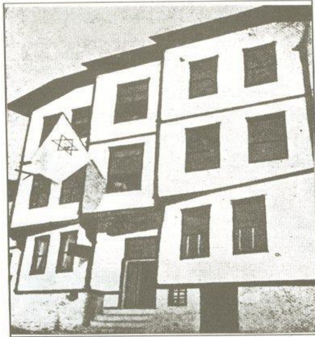
İlk defa alttaki odada çalışıldı

Tarihe mal olmuş, Cumhuriyetimizle yaşıt, içinde II. Abdülhamit Döneminde yapılmış tarihi iki çeşmenin bulunduğu bu alanın araştırılması, bir sosyal hizmet modelinin geçmişten geleceğe uzanan köprüsü demektir.