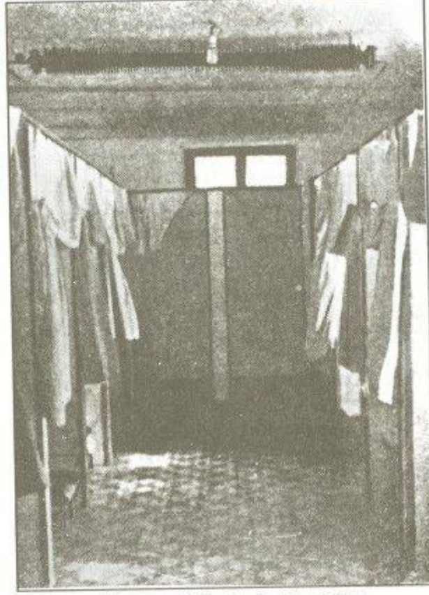
Banyo dairelerinden biri