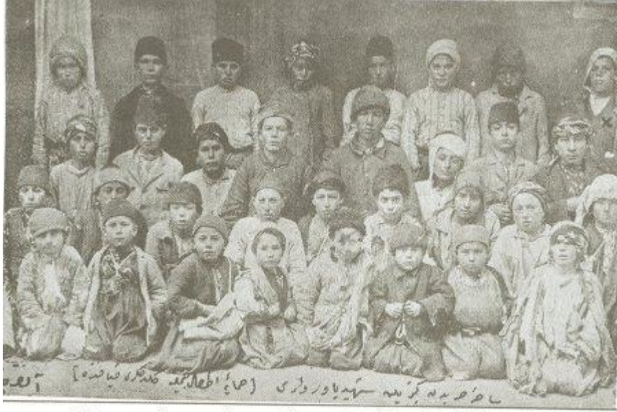
Harp sahasından gelen çocuklardan bir grup (Geldikleri kıyafetle)

Zaman içinde yuva ve yurtların sayıları hızla artmıştır. Yuva ve yurtların sayılarının yanı sıra, bu kurumların çocukların gelişimine verdiği onulmaz zararlara ilişkin araştırmaların sayısı da hızla artmıştır. 6